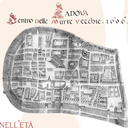
Padova dentro le mura vecchie, 1606. Disegno a china su carta. Archivio di Stato di Padova, Corporazioni Religiose Soppresses, S. Maria di Praglia, b. 83, disegno 1.