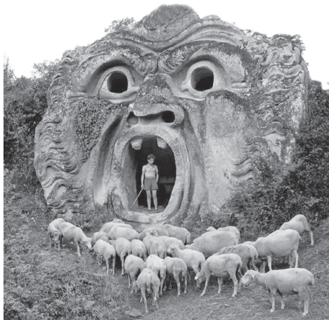
Un pastorello e le sue pecore nei pressi di una delle sculture del Parco dei Mostri di Bomarzo (Viterbo) (noto anche come Sacro Bosco). Il parco è un giardino monumentale ideato da Pier Francesco Orsini nel XVI secolo.

Dalla tosatura alla realizzazione di tessuti, il ciclo tessile è un processo articolato che unisce abilità manuali e conoscenze tecniche. La filatura e la tessitura trasformano la fibra grezza in prodotti finiti, utilizzati in ambiti che spaziano dall'abbigliamento agli arredi per la casa, fino agli utilizzi simbolici e rituali. La versatilità della lana ha favorito anche pratiche di riciclo e riuso, dimostrando l'ingegno delle comunità nell'ottimizzare le risorse disponibili.